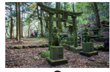
MAP 10 葛原集落跡 林の中に住居の跡である石組みや御社の跡が残る。鳥居の両側には小さな可愛らしい仁王像が並ぶ。