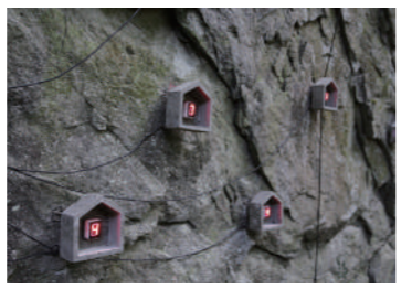
MAP 14 『Hundred Life Houses』 宮島達男 [ 場所 ] 国東町成仏854 成仏岩陰道跡入口