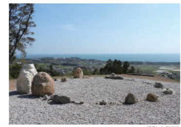
MAP 15 『首飾り—石を持って山に登る』 島袋道浩 [ 場所 ] 国東町綱井 祇園山