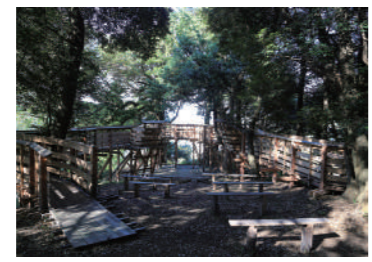
MAP 13 『説教壇』 川俣正 [ 場所 ] 国見町破部536

国東にはアントニー・ゴームリーの作品以外にもさまざまな現代アートが点在し、2021年にも新たな作品が誕生した。国東の自然に溶け込むアートを探すのも国東旅行の醍醐味の一つ。